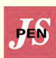
イラスト 日高修、小谷穰治