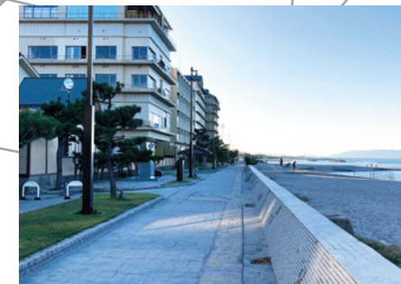
皆生・海岸遊歩道