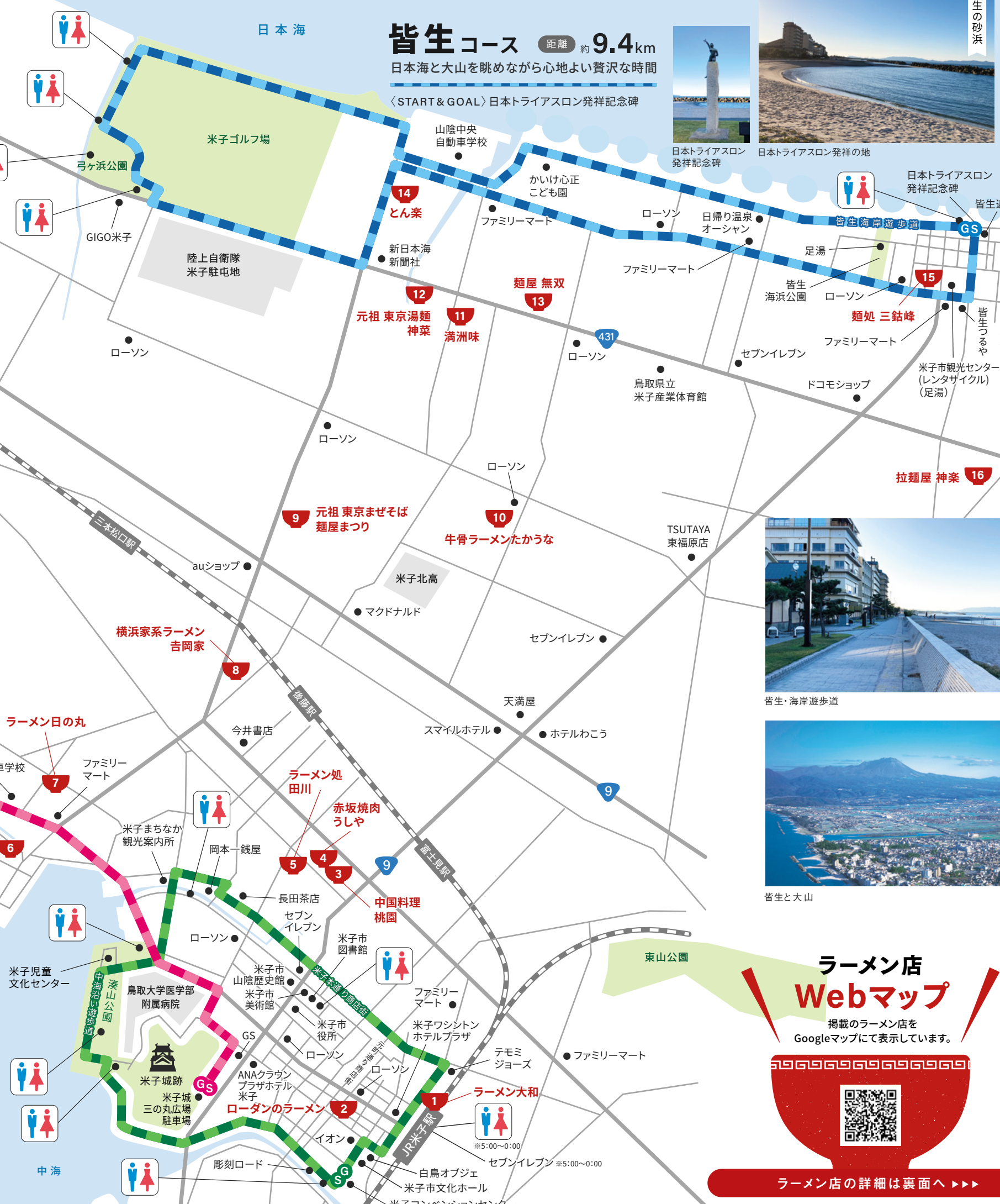
湊山公園(中海沿い遊歩道)