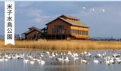
米子水鳥公園 案内看板 水鳥薬局 粟島神社 山陰合同銀行 黄杏ビックタイガ