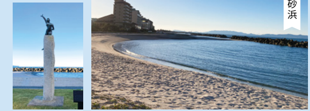
日本トリアスロン発祥記念碑 日本トリアスロン発祥の地