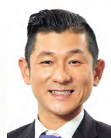
笑い飯・哲夫 <司会進行> 漫才師