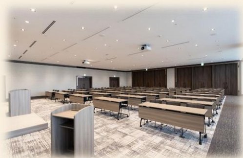
【ブース設置会場写真】

※出展内容については事前に確認をさせていただきます。 参加者へのアンケートの実施は可としますが、 イベント全体の進行を妨げるような過度な勧誘行為等はお控えください。