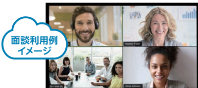
面談利用例 イメージ