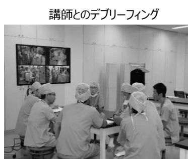
講師とのデブリーフィング