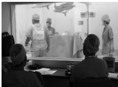
4つのシナリオシミュレーションを実施