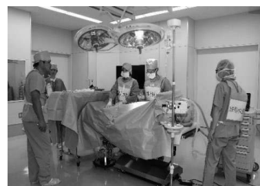
他施設の経験も共有