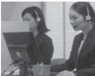
2. 急性疾患発症の可能性がある異常をコールセンターに通知