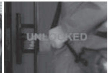
5. 遠隔操作で玄関錠の解錠・施錠を行い救急隊員の患者接触を支援

※『生活者参加型パイロットプロジェクト』として お客様新築住宅にて検証実施 (期間: 2020年12月~2022年10月)