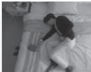
3. 宅内設置のスピーカー・マイクに懸隔接続して安否確認