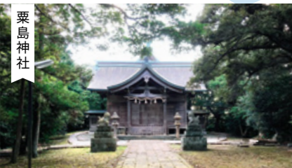
「神の宿る森」の187段の石段を登った先に本殿があり、中腹の展望台から見渡せる、中海の大パノラマは圧巻です。