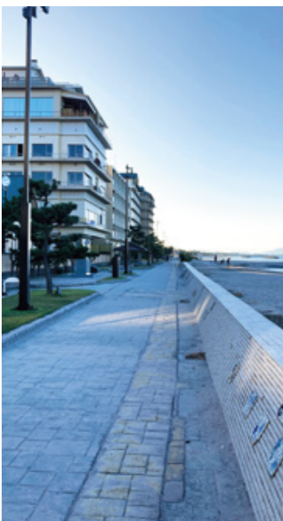
皆生・海岸遊歩道