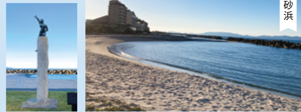
日本トリアスロン発祥記念碑 日本トリアスロン発祥の地