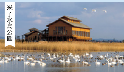
水鳥をはじめ様々な生き物達を観察できる。山陰屈指の野鳥の生息地。公園内からは、名峰・大山が一望できます。